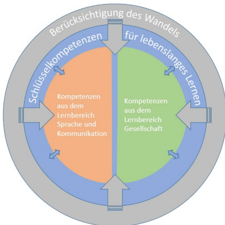
Abbildung 1: Berücksichtigung des Wandels beim Aufbau der Kompetenzen

So wie die Ziele der nachhaltigen Entwicklung Teil einer globalen und verantwortungsbewussten Perspektive des Wandels sind, zielt die Allgemeinbildung in der beruflichen Grundbildung auf ihrer Ebene darauf ab, die Integration der Lernenden in eine sich ständig weiterentwickelnde Gesellschaft zu fördern.